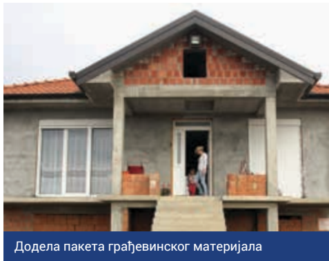
Додела пакета грађевинског материјала