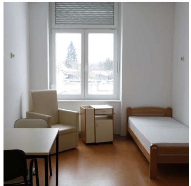
Korisnička soba u Domu za 75 starijih osoba i osoba sa invaliditetom u Glini

HR1 završeno Izgradnja stambene zgrade za 29 obitelji u Korenici