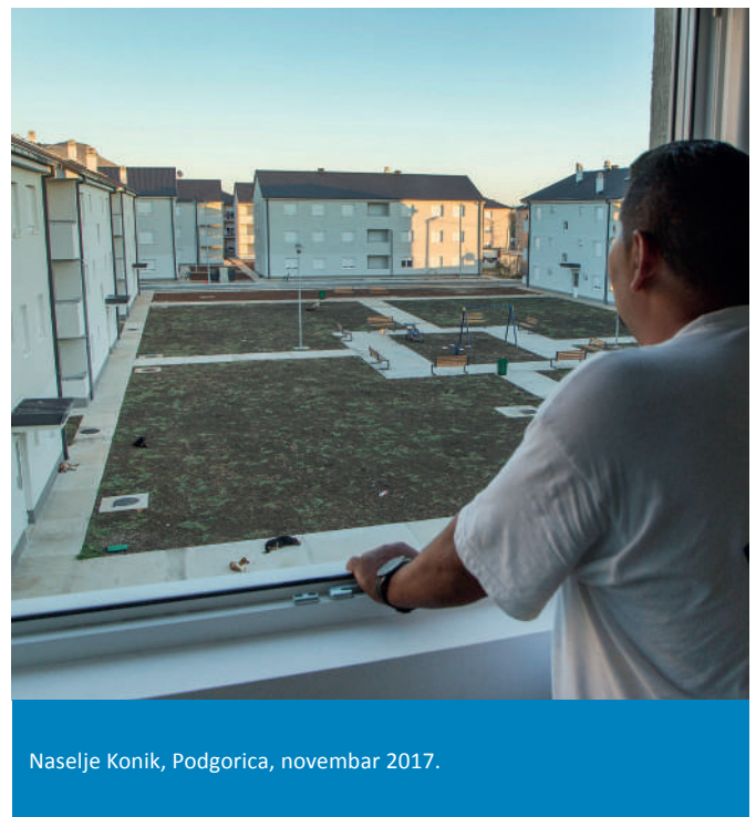
Naselje Konik, Podgorica, novembar 2017.