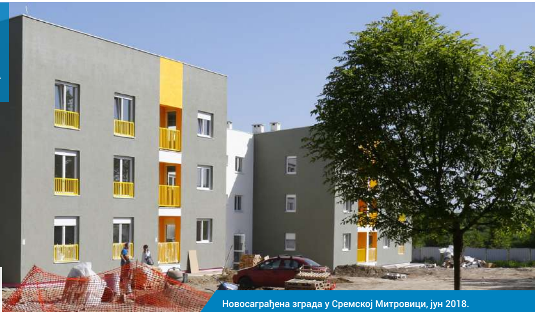
Новосаграђена зграда у Сремској Митровици, јун 2018.